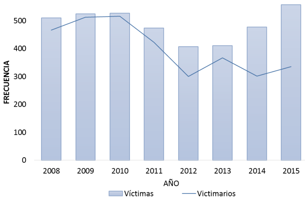
Gráfico 1. Cantidad de homicidios y cantidad de presuntos homicidas

Según datos que permiten contrastar la cantidad de homicidios versus la cantidad de presuntos homicidas, en el gráfico 1 se observan las diferencias en estas cantidades, adicionalmente, la tabla adjunta al gráfico muestra que la relación de homicidas ha aumentado en el periodo de estudio, cuando para el periodo 2008-2011 la cantidad de victimarios era casi la misma que la cantidad de víctimas (relación 1 a 1), a partir del año 2012 esta proporción cambió alcanzando 1,7 víctimas por cada victimario en promedio en el año 2015.